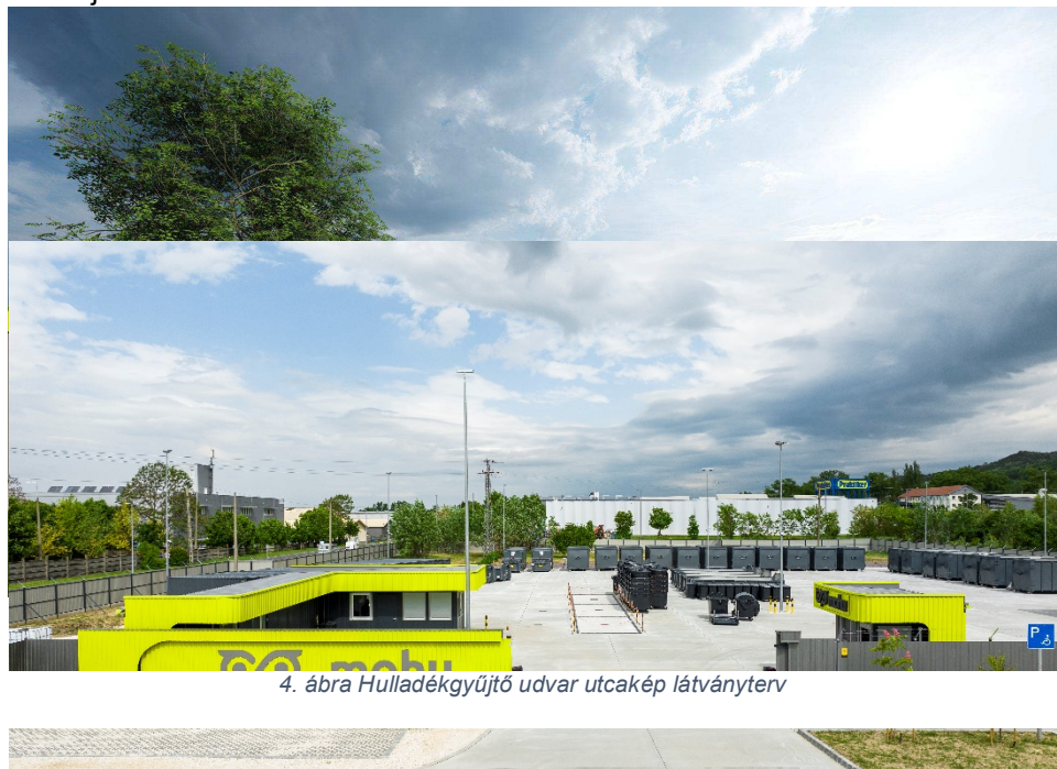
4. ábra Hulladékgyűjtő udvar utcakép látványterv