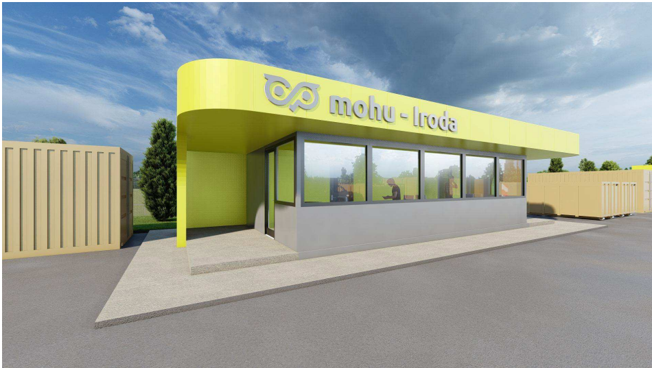
3. ábra Szociális konténer látványterv