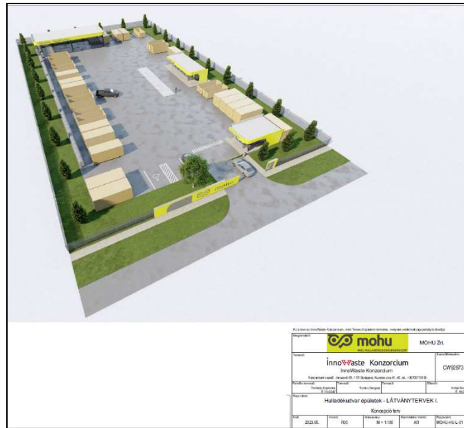
1. ábra MOHU által tervezett hulladékgyűjtő udvarok felülnézeti látványterve

A hulladékgyűjtő udvarok számának növelésével, illetve alábbiak szerinti műszaki kialakításának biztosításával kívánjuk elérni, hogy a közvetlenül és közvetetten elérhető lakosság körében teljeskörű, a lehető legtöbb hulladéktípust magába foglaló, megfelelő kapacitást biztosító szelektív hulladékgyűjtési szolgáltatás alakuljon ki, ezáltal ösztönözve a lakosságot a szelektív hulladékok leadására. Továbbá ezen kialakítandó hulladékgyűjtő udvarok - optimális gyűjtési pontok révén – szolgálhatnak a bevezetni tervezett mobil hulladékudvari és egyéb szelektív gyűjtési szolgáltatási folyamatok végpontjaiként is.