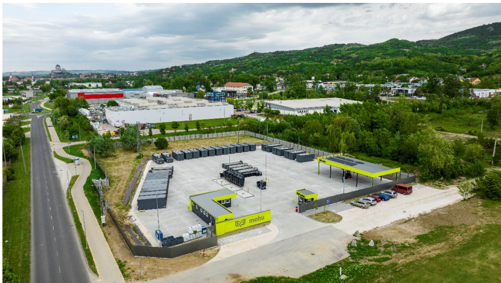
2. ábra MOHU által Esztergomban megvalósított hulladékgyűjtő udvar felülnézetből